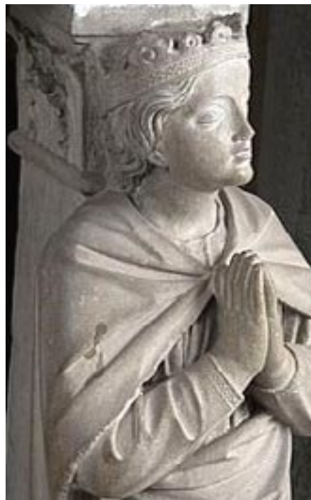
La Speranza, particolare sarcofago del Cardinale Branda Castiglioni (1443)

vita" e, ancora, quanto dolore, quanta sofferenza vediamo attorno a noi. Sembra quindi impossibile vedere spiragli di